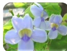
ดอกไม้ประจำวิทยาลัย ดอกสร้อยอินทนิล