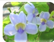
ดอกไม้ประจำวิทยาลัย ดอกสร้อยอินทนิล